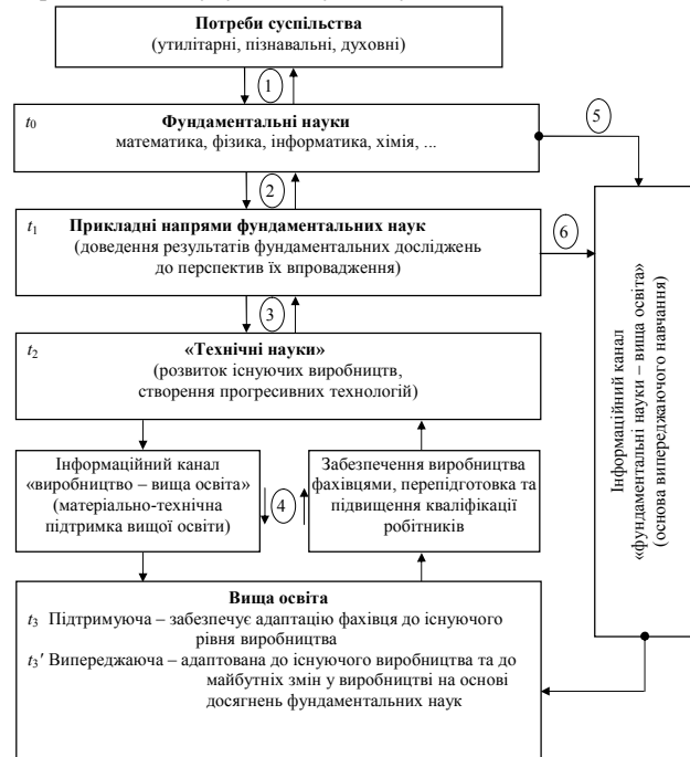
Рис. 2. Взаємозв'язок між фундаментальними науками, виробництвом та вищою освітою

На рис. 2 показано взаємозв'язки між фундаментальними науками, виробництвом і освітою. У центральній частині рисунка стрілками позначені напрями циркуляції наукових досягнень, що породжує, стимулює та розвиває виробництво, науку та вищу освіту.